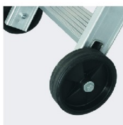
Roues Ø 160 mm