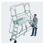
Déplacement sur 2 roues