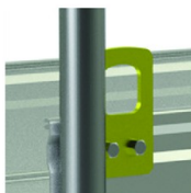
Anneaux de grutage